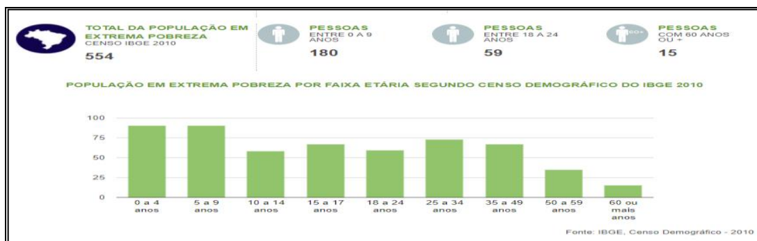
FIGURA 01 DA POPULAÇÃO EM EXTREMA POBREZA