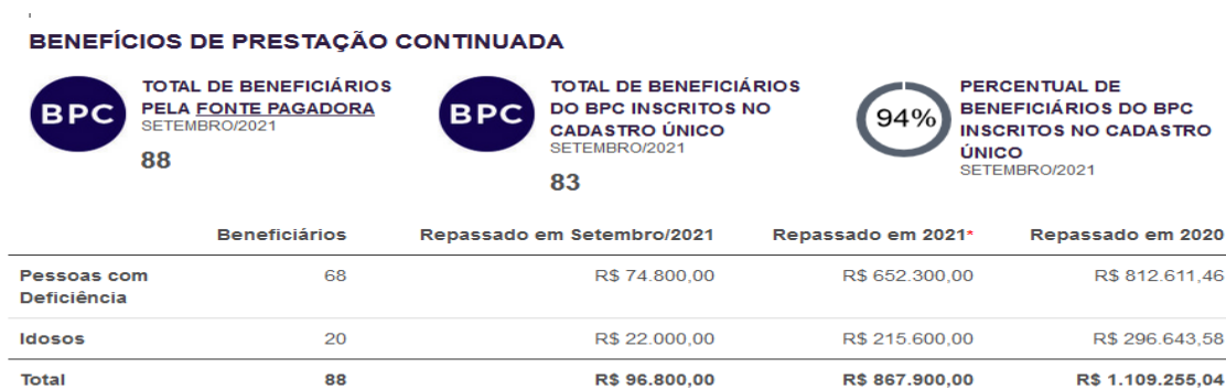
FIGURA 02 DO BPC PCD E IDOSO

* Referente aos meses de jan/2021, fev/2021, mar/2021, abr/2021, mai/2021, jun/2021, jul/2021, ago/2021 e set/2021.